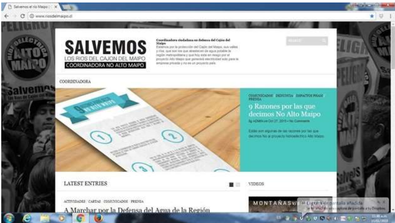
Figura 03- Captura de pantalla web del movimiento No Alto Maipo, con los 9 motivos de oposición al PHAM, base de la plataforma de reivindicación en el conflicto.

El movimiento cuenta con una página web oficial cuyo sitio es www.riosdelmaipo.cl con usuario en Twitter #NoAltoMaipo, Facebook NoAlProyectoAltoMaipo, Instagram y un canal oficial YouTube con 78 videos publicados a mayo del 2017 identificados como “No Alto Maipo”. Para el caso de la página de Facebook, La Coordinadora la utiliza con una finalidad concreta de difusión.