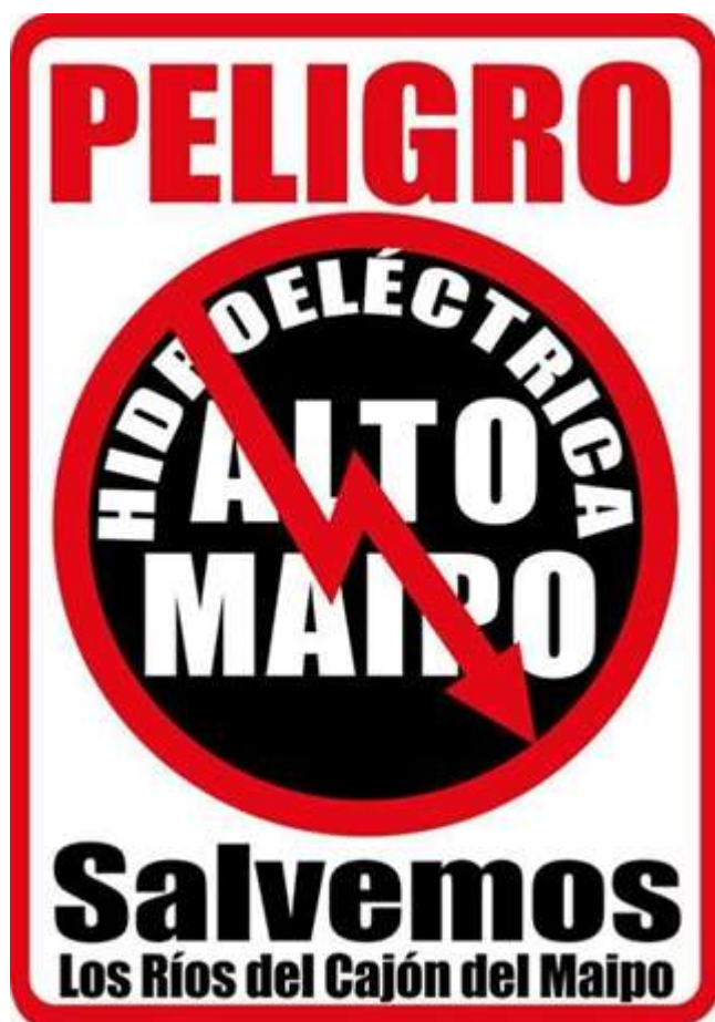
Figura 02. Afiche oficial Movimiento No Alto Maipo

Entonces, observando el rol de las redes sociales virtuales para el movimiento, y atenta a la participación que como usuaria realizo de estas redes, siempre reconociéndome investigadora en esas interacciones, comienzo a considerar la relevancia que para esta investigación tenían las redes sociales virtuales también como herramienta metodológica, incorporando en el trabajo de campo antropológico, la dimensión virtual.