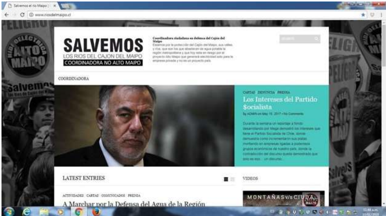
Figura 04 - Captura de pantalla página web oficial del movimiento No Alto Maipo, comunicando en el año 2017 la implicancia del partido socialista.

Como una forma de visibilizar el conflicto, masificar sus actividades y lograr el aumento de la adhesión a sus demandas, La Coordinadora comienza desde el año 2011 a utilizar las redes sociales como una de sus principales estrategias comunicacionales, especialmente para las personas que no habitan el sector.