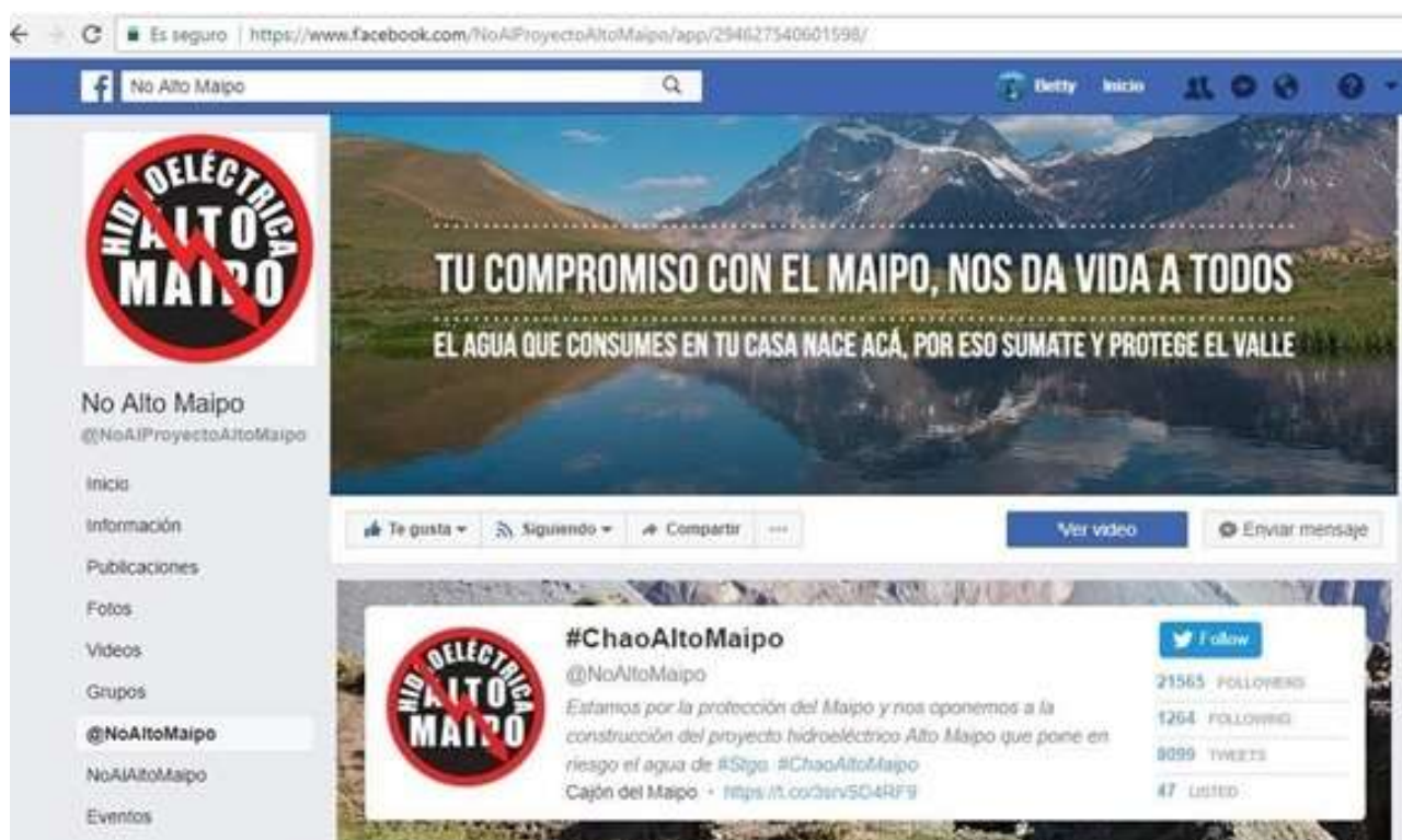
Figura 05- Captura de pantalla de la cuenta oficial de Facebook del movimiento No Alto Maipo