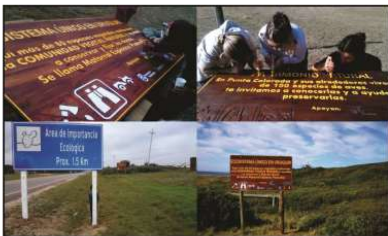
FIGURA 6. Fotografías de las jornadas de pintado de carteles en Punta Negra con vecinos. Cartelería institucional (MTOPI-DNV) instalada en Edén Rock y cartel artesanal instalado en Punta Negra.

Para la elaboración de la cartelería se tuvo un criterio unificador con las utilizadas en áreas protegidas, consistente en carteles artesanales de madera dura con