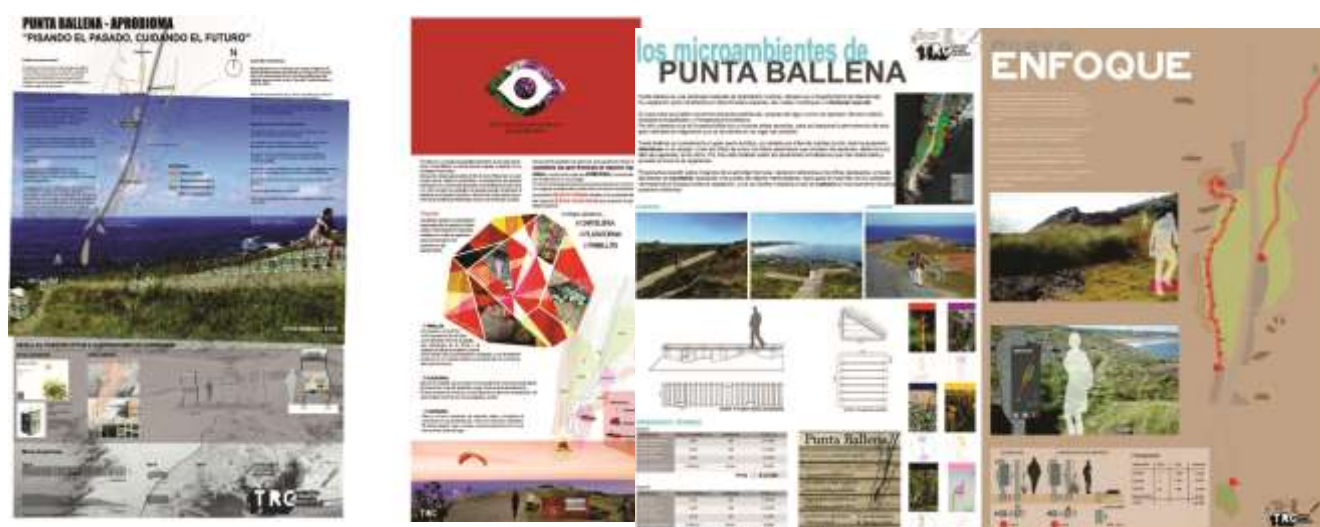
FIGURA 5. Proyectos elaborados por estudiantes de Lic. Diseño del Paisaje como propuestas de sistema interpretativo de parche de vegetación costera en Punta Ballena.