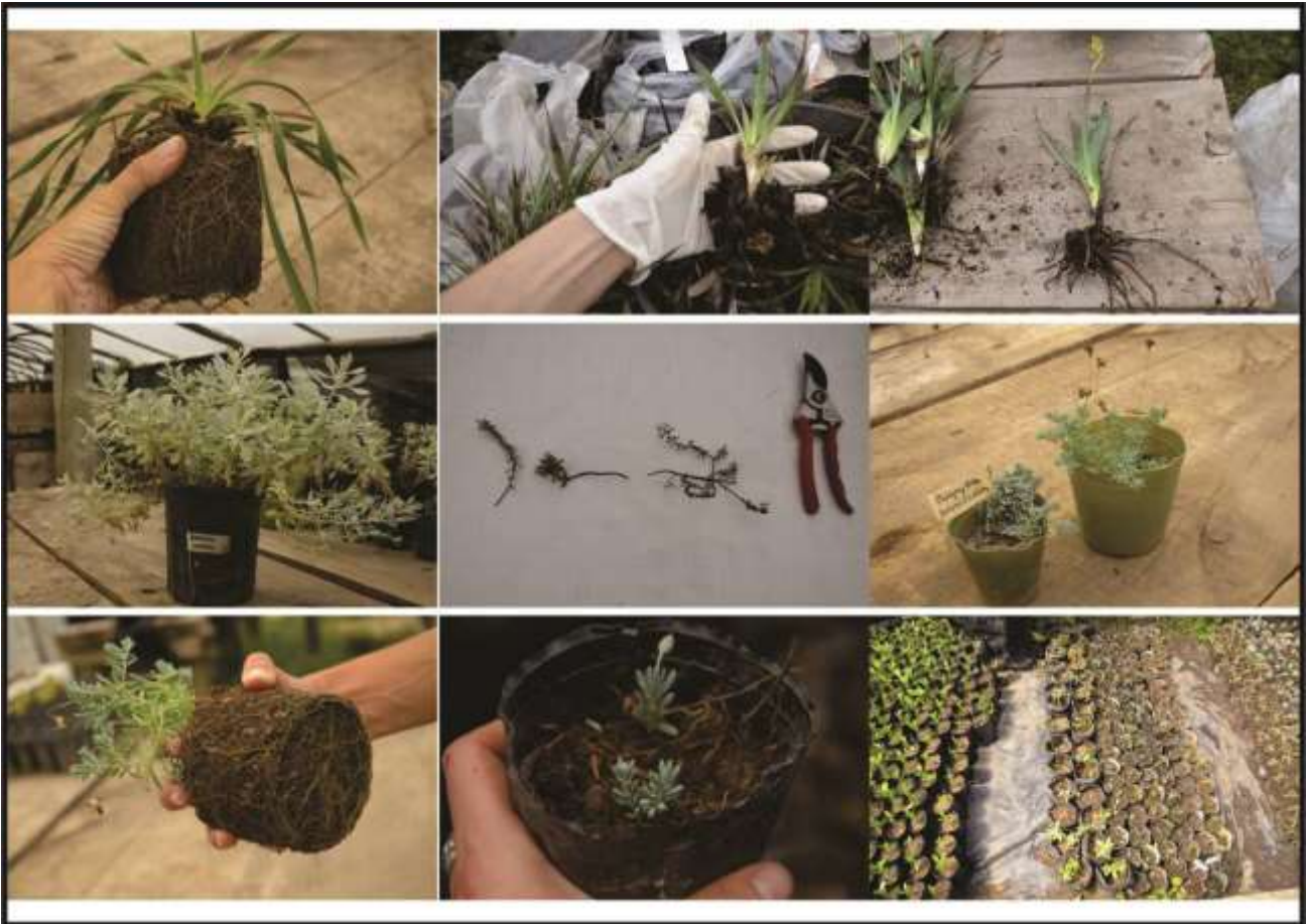
FIGURA 10. Actividades de propagación de especies costeras con potencial ornamental.

Las especies del herbazal rupícola de Punta Ballena presentan un gran potencial para su utilización en techos verdes como por ejemplo Senecio ostenii , Porophyllum linifolium , Dyckia remotiflora , Aspilla montevidiensis y Euphorbia caespitosa . Estas especies presentan un sistema radicular superficial adaptado a baja disponibilidad de agua.