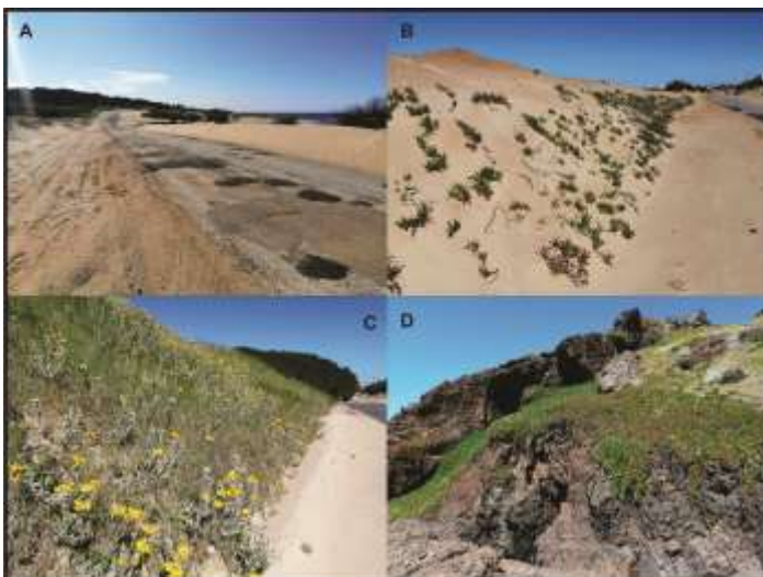
FIGURA 11. A Rambla de Punta Colorada en 2019 luego del movimiento del cordón dunar con maquinaria pesada. B Rambla de San Francisco con las dunas con Carpobrotus edulis recientemente instalado por la Intendencia Municipal. C Duna a poca distancia de la foto B con duna fijada con especies autóctonas. D. Acantilado de Punta Ballena con Carpobrotus edulis avanzando sobre la vegetación autóctona.

Creemos que el proceso de Remanentes Verdes de la Costa ha sido muy enriquecedor para todos aquellos que han colaborado en el proceso de generación de conocimiento científico, así como también en la generación de un conocimiento respecto al “hacer colectivo” en esta temática. Consideramos pilares de la experiencia las instancias de capacitación y creación colectiva, tanto para los estudiantes de Diseño de Paisaje de UdelaR, para los de Conservación de Recursos Naturales de UTU, para integrantes de APROBIOMA y comisiones vecinales.