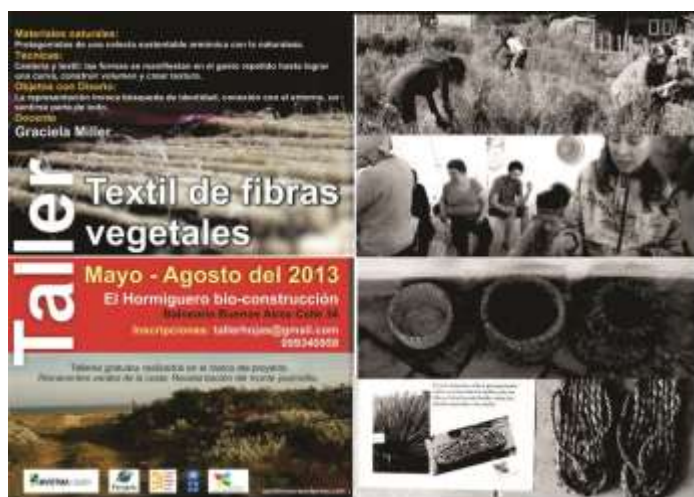
FIGURA 8. Afiche de convocatoria a Taller de Fibras y fotografías de los trabajos realizados con fibras vegetales en los talleres.

El éxito de estos talleres fue un insumo para que la Intendencia Departamental de Maldonado incluyera mayor número de talleres en el uso de fibras, dictados por la misma docente, en varios puntos del departamento, dada la demanda que los mismos alcanzaron a raíz del proyecto.