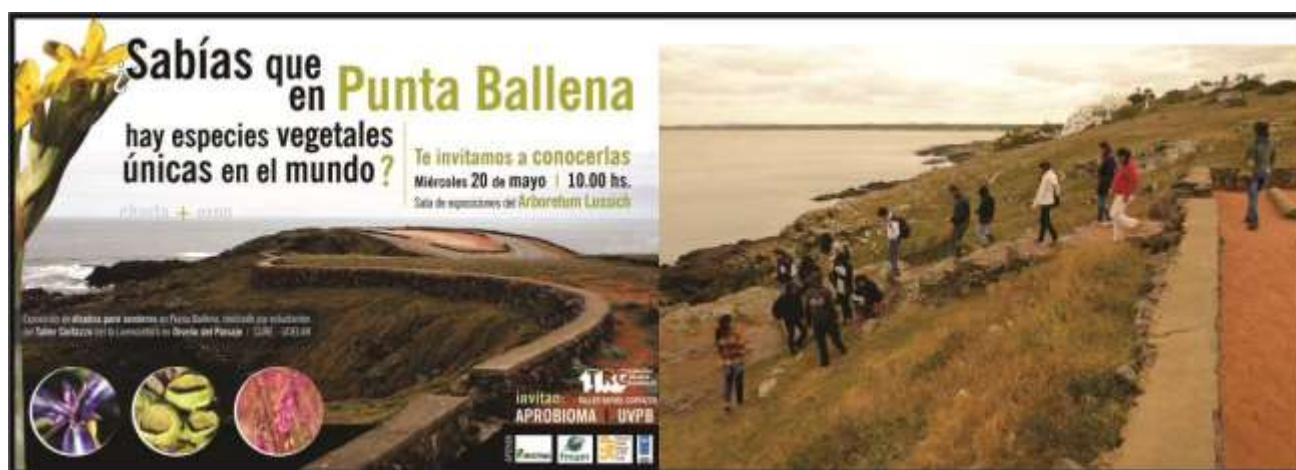
FIGURA 4. Afiche de convocatoria a actividad en Punta Ballena para la exposición de los trabajos realizados por estudiantes de Lic. Diseño del Paisaje como propuestas de sistema interpretativo de parche de vegetación costera en Punta Ballena. Fotografía de recorrida en el parche de Punta Ballena con estudiantes y vecinos.

En Punta Ballena se trabajó de forma fluida con la Unión Vecinal de Punta Ballena (UVPB) y con el Taller Cortazzo de Diseño de Paisaje de la Licenciatura en Diseño de Paisaje del CURE. En abril-mayo de 2015 el sistema interpretativo que presente al visitante la importancia de los herbazales rupícolas costeros con sus endemismos fue abordado curricularmente por estudiantes del Taller. Luego de recorridas de reconocimiento del área y