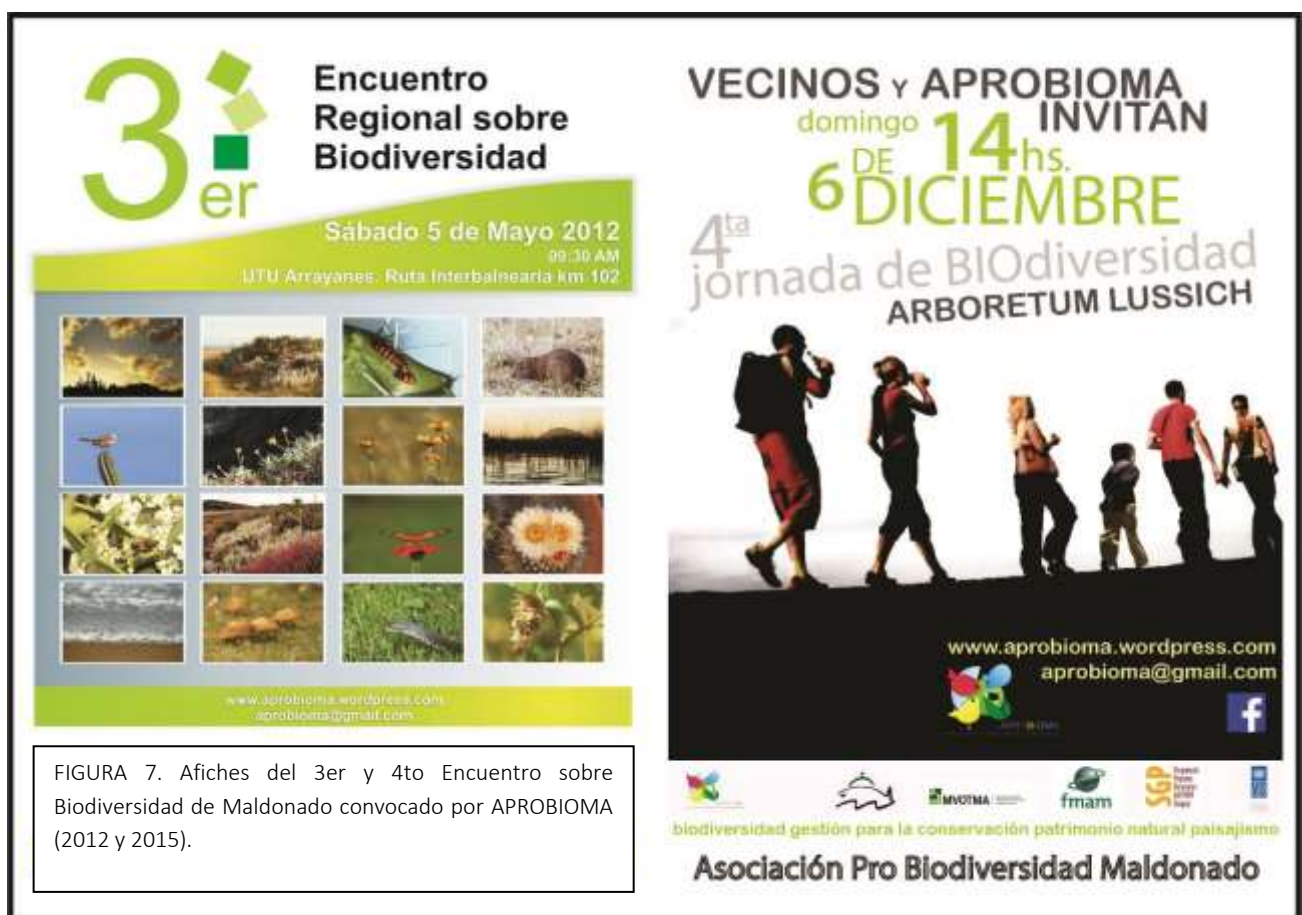
FIGURA 7. Afiches del 3er y 4to Encuentro sobre Biodiversidad de Maldonado convocado por APROBIOMA (2012 y 2015).

En sinergia con la capacitación mencionada se desarrolló como estrategia de difusión e intercambio la organización de eventos, presentaciones en congresos y muestras itinerantes con fotografías, relatos, plantas y objetos artesanales que cobraron un rol fundamental, así como recorridos ecoturísticos en los parches. Los eventos destacados en cuanto a la difusión y sensibilización fueron organizados por APROBIOMA, titulados “Segundo, (Tercer y Cuarto) Encuentro Regional sobre Biodiversidad en Maldonado” en los cuales participaron expositores de alto nivel y un gran número de personas asistentes. Los mismos se desarrollaron en el Club de Punta Colorada (2011), en UTU Arrayanes, Piriápolis (2012) y en el Arboretum Lussich (2015). La organización de eventos y la participación en congresos resultaron de gran eficacia para amplificar la sensibilización dentro de la zona de actuación y lograr llegar a personas de otras zonas y regiones.