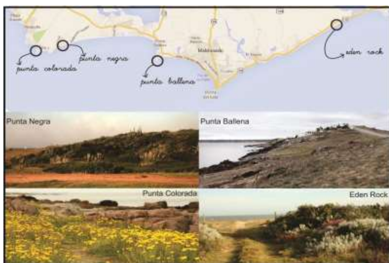
FIGURA 1. Ubicación de los parches de vegetación costera sobre los cuales trabajo el Proyecto Remanentes Verdes de la Costa, APROBIOMA.

De manera formal el objetivo general del proyecto fue contribuir a la valorización y conservación de parches remanentes de vegetación nativa presentes en la faja costera del departamento de Maldonado de forma participativa. Los objetivos específicos consistieron en: 1) manejar tres parches de vegetación costera localizados en Punta Colorada-Punta Negra, Punta Ballena y Edén Rock (próximo a J. Ignacio) con fines de conservación, en conjunto con los actores locales; 2) la educación ambiental en torno a la importancia ecosistémica de los parches relictuales y nuevas posibilidades de utilización sostenible (fibras, ornamental, paisaje, ecoturismo) de forma que permita la generación de ingresos económicos a las comunidades locales y 3) fortalecer la red de actores locales, fomentando el intercambio de información, nucleando actores locales y regionales para generar opinión pública que active la formulación de políticas municipales y/o gubernamentales. Las áreas de trabajo seleccionadas fueron tres puntos representativos de la costa de Maldonado: Punta Negra y Punta Colorada, Punta Ballena y Edén Rock.