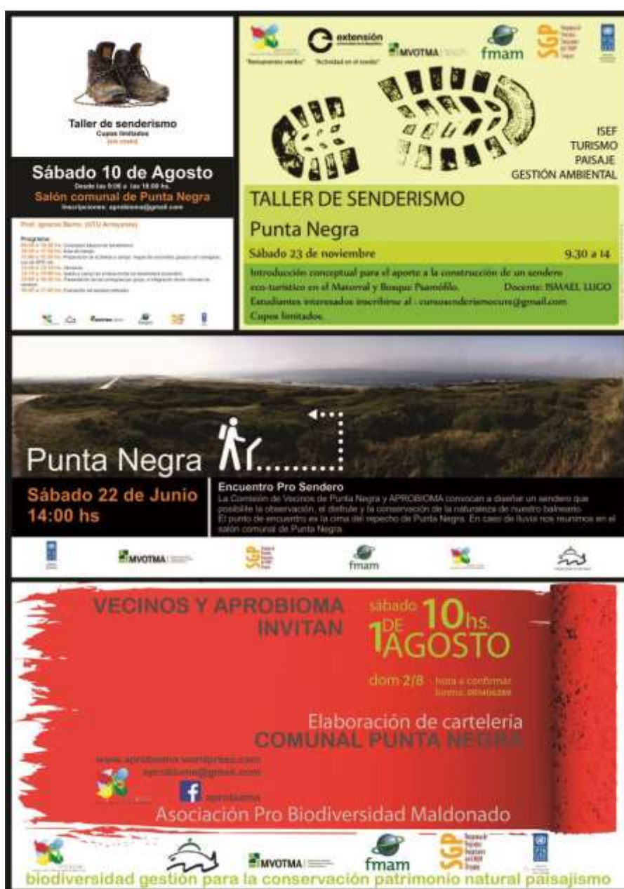
FIGURA 2. Afiches y flyers enviados para las convocatorias a talleres y jornadas realizadas en Punta Negra- Punta Colorada para la participación en el diseño, elaboración e instalación del sistema de interpretación del parche.

Estos valiosos aportes fueron los cimientos para iniciar una segunda etapa basada en la difusión de estos resultados, la generación de propuestas y la educación ambiental y (Tabla 1).