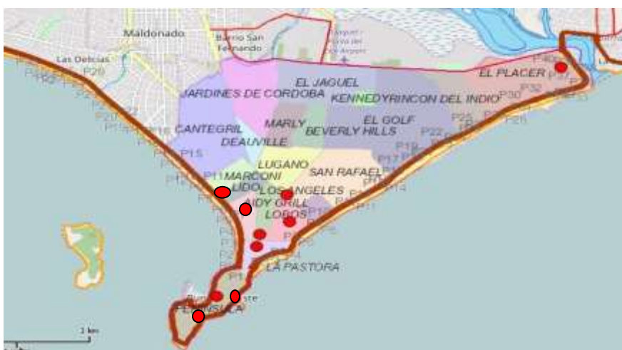
Figura 3. Principales proyectos presentados en la Alcaldía de Punta del Este, elaboración propia.

El principal tipo de desarrollo inmobiliario en los expedientes analizados son edificios en altura; también se proponen proyectos de hotelería y un barrio jardín privado. Los mismos están distribuidos principalmente en las localidades de Maldonado y Punta del Este.