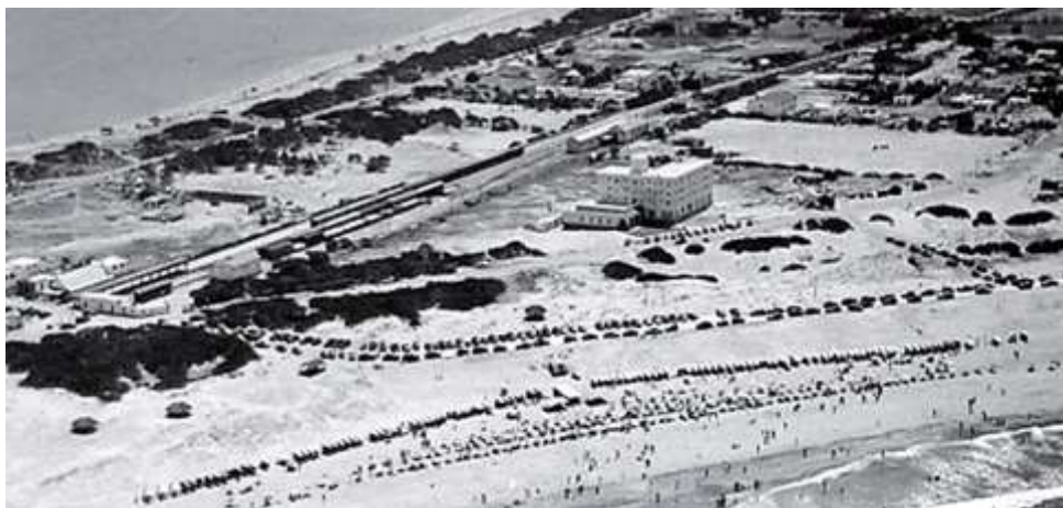
Figura. 1 década

De este modo, aún cuando se reivindique el ordenamiento territorial como una función pública esencial (art. 2 LOTDS) serán los privados quienes financien los intereses generales con cargo a la recuperación, por parte del Estado, de los mayores aprovechamientos urbanísticos generados en el proceso (art 46 de la LOTDS). La finalidad es hacer posible la ejecución del planeamiento facilitando los conflictos entre las directivas de éste y la realidad física y jurídica del suelo; la obtención de recursos por medio de la recuperación de parte del mayor valor inmobiliario no constituye un fin en sí mismo; es un instrumento que busca hacer compatibles: el pago de las infraestructuras del resto de la ciudad y la liberación del presupuesto público respecto del costo de la ciudad en su conjunto.