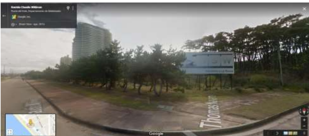
Figura 7. Proyecto Venetian Tower.