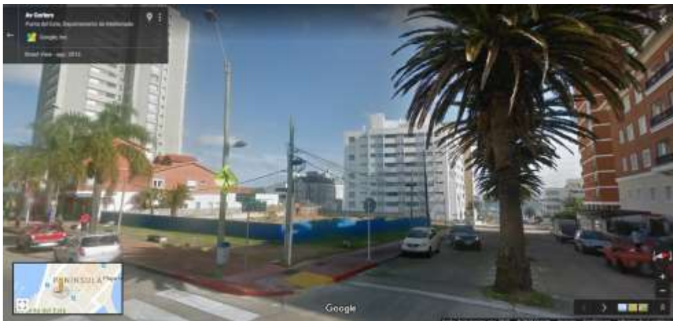
Figura 8. Proyecto World Trade Center.