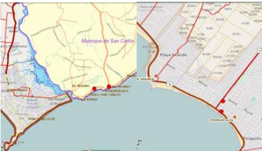
Figuras 5 y 6. Principales proyectos presentados en Alcaldías de San Carlos y de Piriápolis respectivamente, elaboración propia.