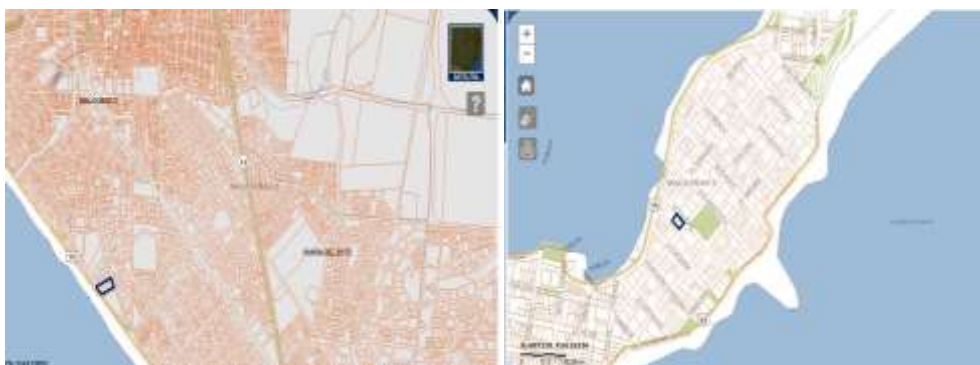
Figuras 9 y 10. Padrón 24521, Manzana 360 (Venetian Tower) y Padrón 523, Manzana 32 (WTC).